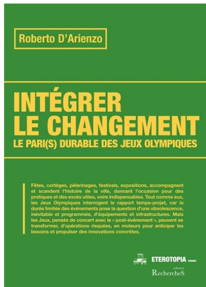
Intégrer le changement : le pari(s) durable des jeux Olympiques Roberto D'Arienzo 796.48 DAR