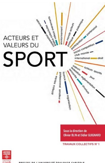
Acteurs et valeurs du sport sous la direction d'Olivier Blin et Didier Guignard 306.483 BLI